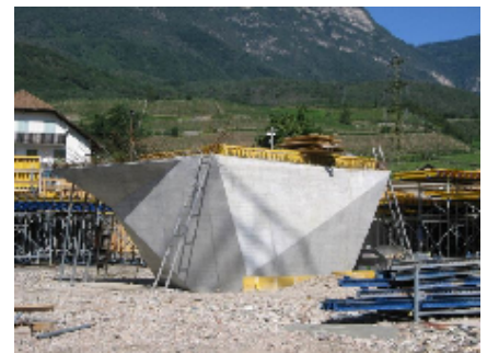
Beton - Aussparungen