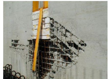
Beton - Aussparungen

Zur Herstellung des Betons standen Sand und gebrochene Zuschläge zur Verfügung, was einen sehr hohen Wasseranspruch bedingte. Aus diesem Grund wurde der Zementgehalt gegenüber der ursprünglichen Betonrezeptur deutlich angehoben, was zu einer stark verbesserten Verarbeitbarkeit und Robustheit des Betons führte.